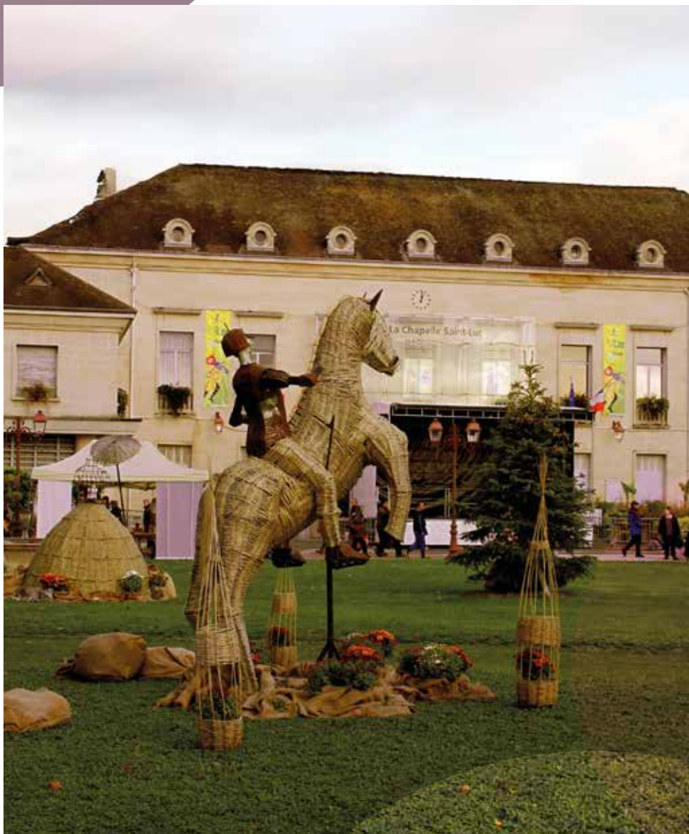
Le mois de la fête de la Saint-Luc !