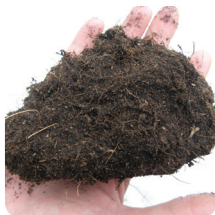
De la tourbe