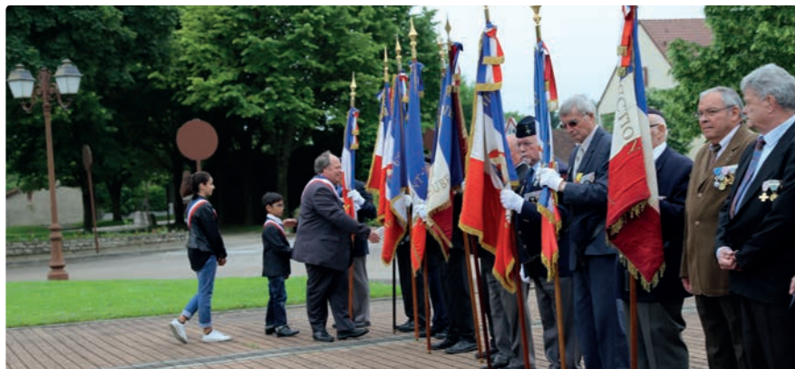
Cérémonie pour la Journée nationale d'hommage aux morts pour la France en Indochine, le 8 juin 2016.