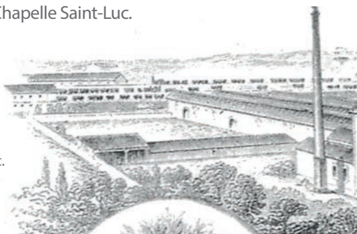
Gravure : les Grandes Malteries de l'Est.

À partir de 1963, la construction d'une ZUP (Zone Urbaine Prioritaire), devenue le quartier Chantereigne, groupant près de 10 000 habitants, donne une physionomie nouvelle à la commune de La Chapelle Saint-Luc.