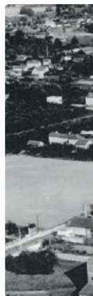
Les rotondes des chemins de fer de l'Est à La Chapelle Saint-Luc.