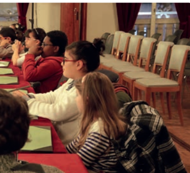
Tournage de l'émission « Coup de jeune », à Canal 32.