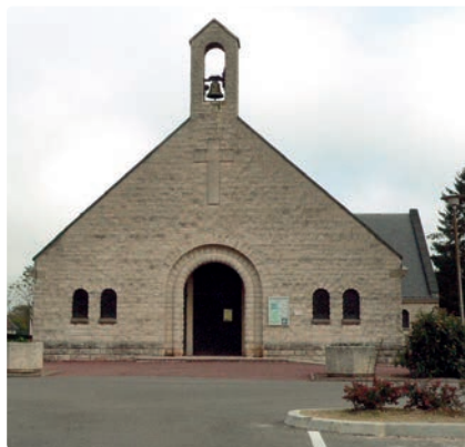
Église du Sacré Cœur.