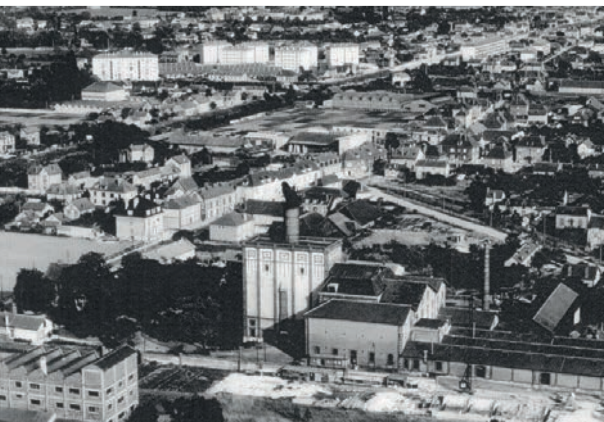
Vue aérienne de la ville en 1963.