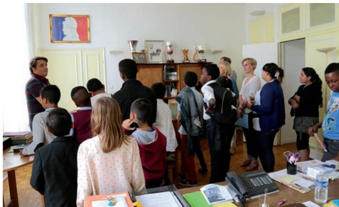
Visite de la mairie, bureau de Monsieur le Maire.