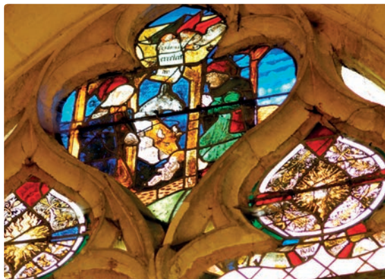
Vitrail de l'église Saint-Luc.