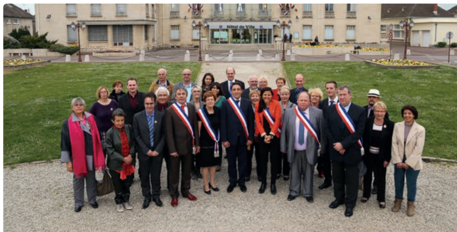
Le conseil municipal de La Chapelle Saint-Luc devant la mairie.