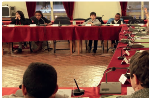
Le CMJ lors d'une assemblée plénière.