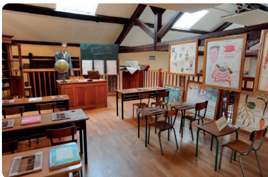
Salle de classe des années 1950.

En 1995, La Chapelle Saint-Luc décide d'immortaliser la mémoire chapelaine en créant un musée ouvert au public. Depuis juin 2000, celui-ci présente un patrimoine qui illustre le 20 e siècle grâce à des dons de familles chapelaines, d'entreprises ou d'amis de la ville.