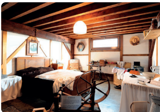
Logement de la première moitié du 20 e siècle.