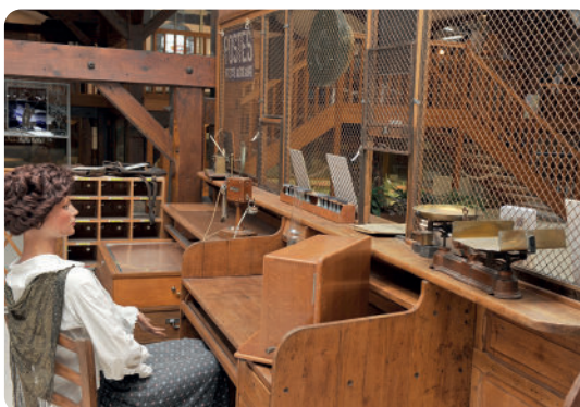
Bureau de poste des années 1930.