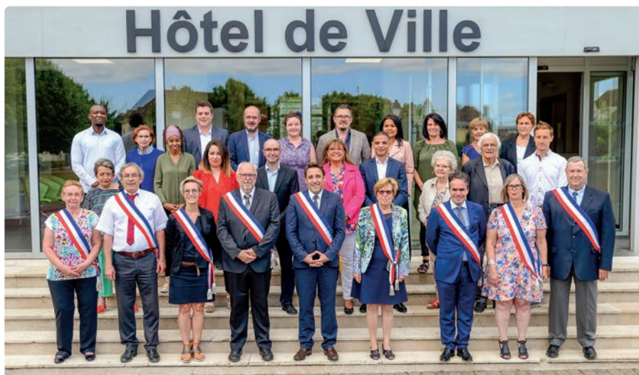
Le conseil municipal de La Chapelle Saint-Luc devant la mairie, en 2020.