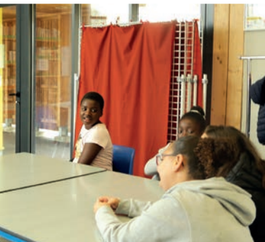
Émission radio à RCF et sortie canoë-kayak.