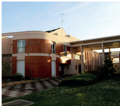
Le Centre culturel Didier Bienaimé.