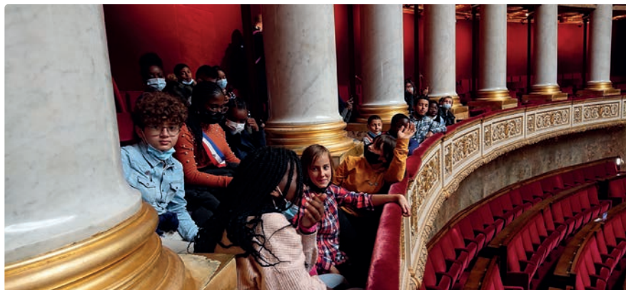
Visite de l'Assemblée Nationale à Paris, le 19 octobre 2021.

une profession, même si cela prend beaucoup de temps!