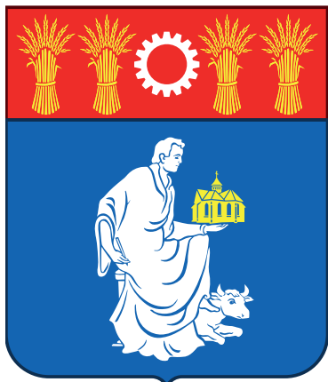
Blason de La Chapelle Saint-Luc.