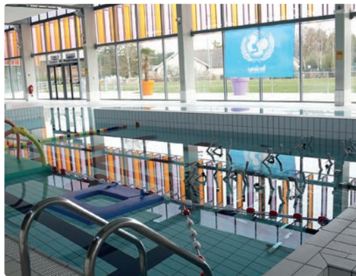
Le complexe aquatique «Aqualuc».