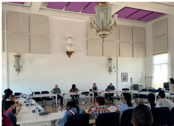
Deuxième assemblée plénière, en juin 2022, en salle du Conseil de l'Hôtel de Ville.