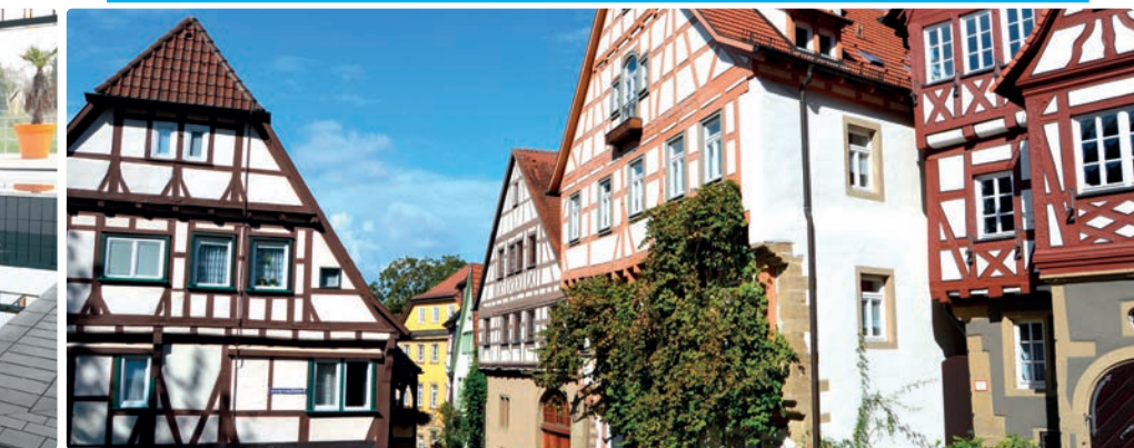
Les maisons à colombages de Neckarbischofsheim.