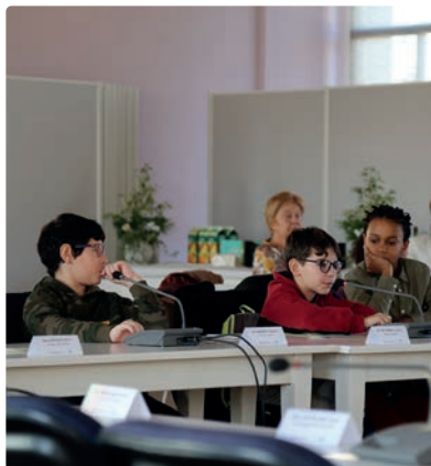
Le CMJ lors d'une assemblée plénière.