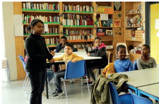
« Les jeunes s'adressent aux jeunes » au CAS Jean Mermoz.